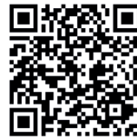
Teknik, Metal & Motor