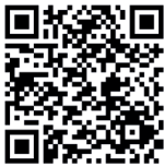
Energi & Byggeri

Mød elever og se værksteder samt køkkener via QR koderne herunder